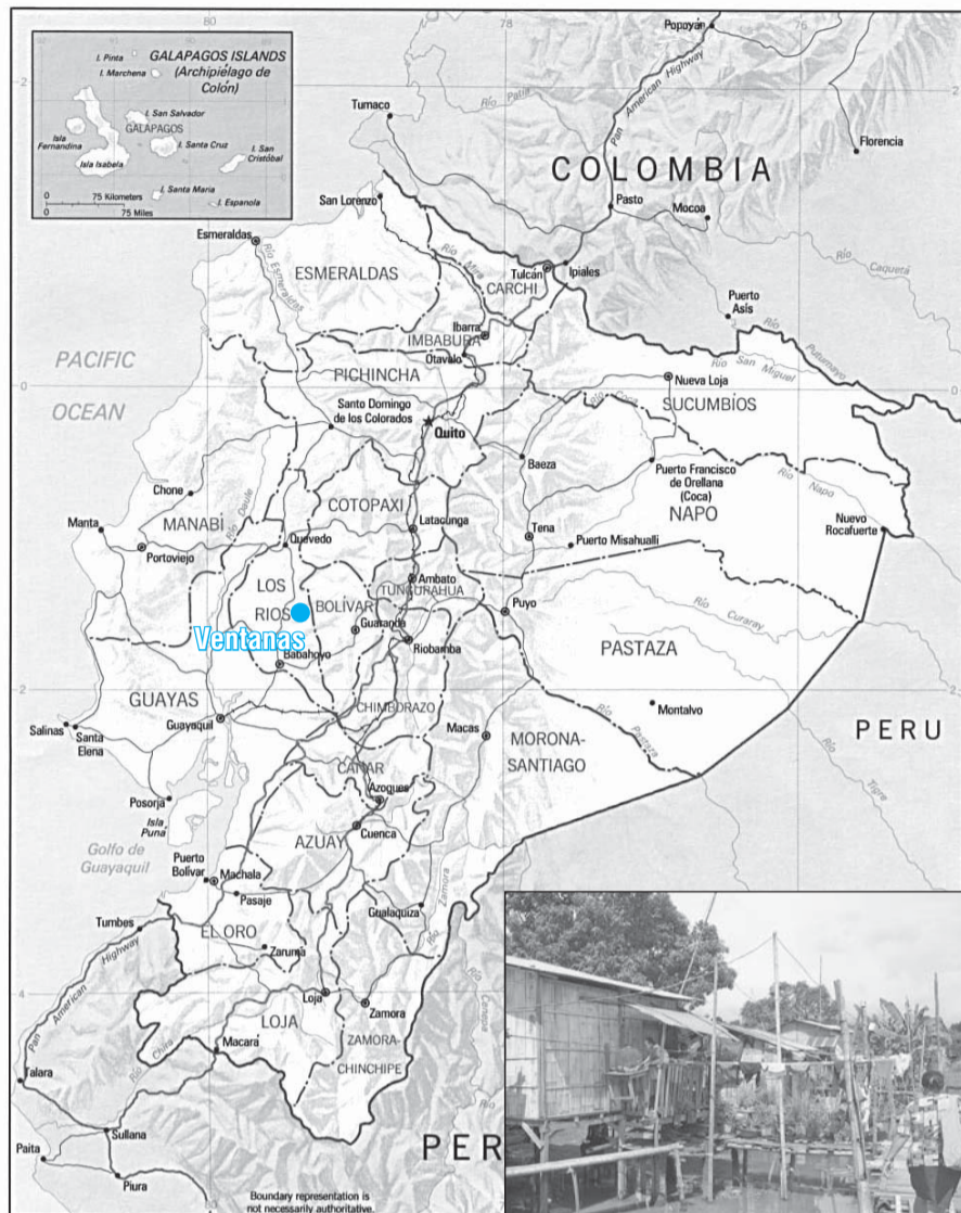
Mapa Ekvádoru s vyznačením města Ventanas a snímek ze zdejšího slumu v bažinaté oblasti.

Ekvádor se vždy řadil mezi chudé státy Jižní Ameriky a lepší situaci nepřineslo ani nalezení ropy v 70. letech, které sice přineslo částečný hospodářský růst a zlepšení situace ve městech, ale celkově země výrazně hospodářsky neposílila. Platí se zde americkými dolary, které před několika lety vystřídaly původní měnu sucre.